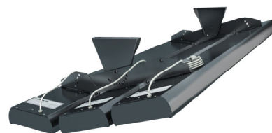
TABELA DOBORU – AKCESORIA