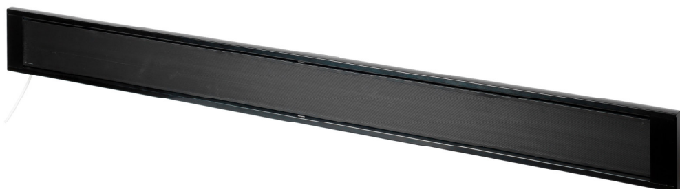
TABELA DOBORU – ECOSUN TH

Promiennik wysokotemperaturowy zaprojektowany do ogrzewania strefowego obiektów takich jak ogrody zimowe, zamknięte lub zadaszone tarasy i balkony, namioty ogrodowe, kościoły i inne pomieszczenia, które zapewniają osłonę przed bezpośrednim oddziaływaniem zjawisk pogodowych. Zapewnia on zwiększenie komfortu cieplnego w ogrzewanej strefie przy temperaturze otoczenia do +5°C. Dołączony standardowo komplet wsporników umożliwia montaż promiennika zarówno na ścianie jak i suficie oraz jego ustawienie pod różnymi kątami. Możliwość zawieszania grupy do 3 promienników TH. Brak efektu świecenia w ciemnych pomieszczeniach. Promiennik wyposażony w 2m przewód przyłączeniowy zakończony wtyczką. Zasilanie napięciem 230V AC w układzie TN-S.